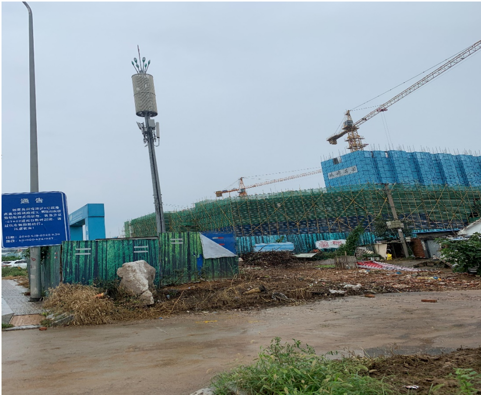
黄岛街道岛外九社区搬迁改造工程（地块六）