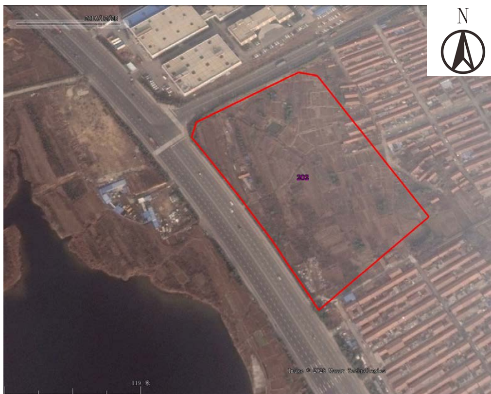
图 3-12 地块及周边历史遥感影像图（2016 年 12 月）