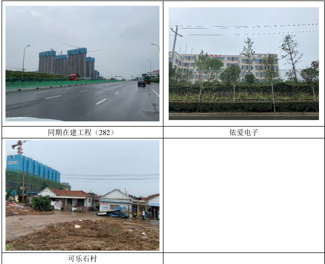
图 3-17 相邻地块使用现状图

本次所调查地块，岛外九社区搬迁改造工程（地块六）北相邻地块为依爱电子，东相邻地块为可乐石村，南相邻地块为可乐石村，西相邻地块为同期在建工程(282)和可乐石水库(经查阅资料显示，可乐石水库非水源地，资料见图 3-18)。