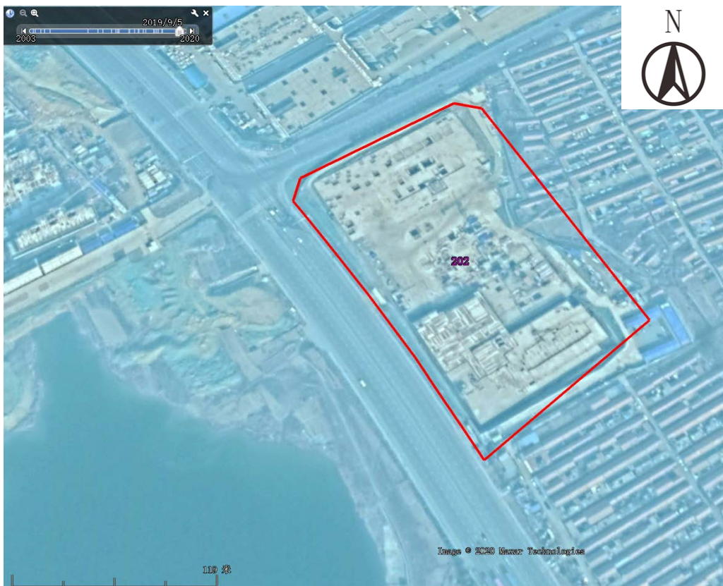
图 3-14 地块及周边历史遥感影像图（2019 年 9 月）