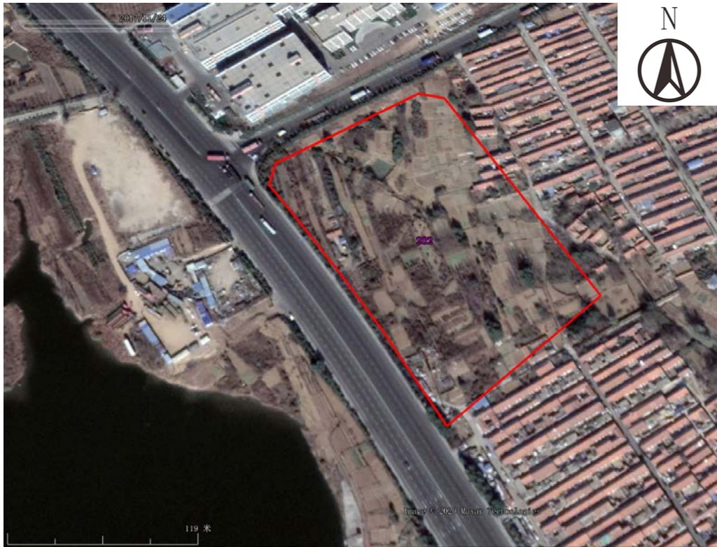
图 3-13 地块及周边历史遥感影像图（2017 年 11 月）