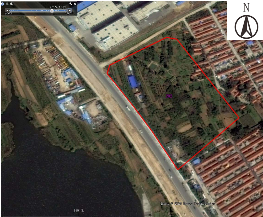
图 3-11 地块及周边历史遥感影像图（2015 年 10 月）