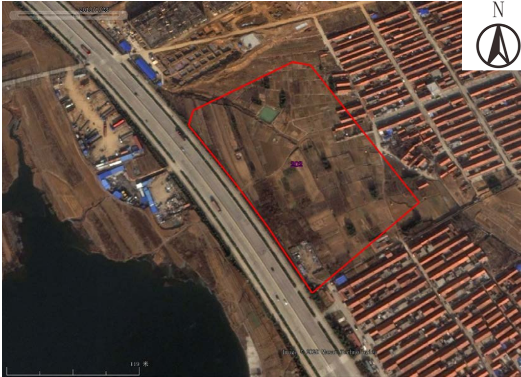
图 3-9 地块及周边历史遥感影像图（2013 年 1 月）