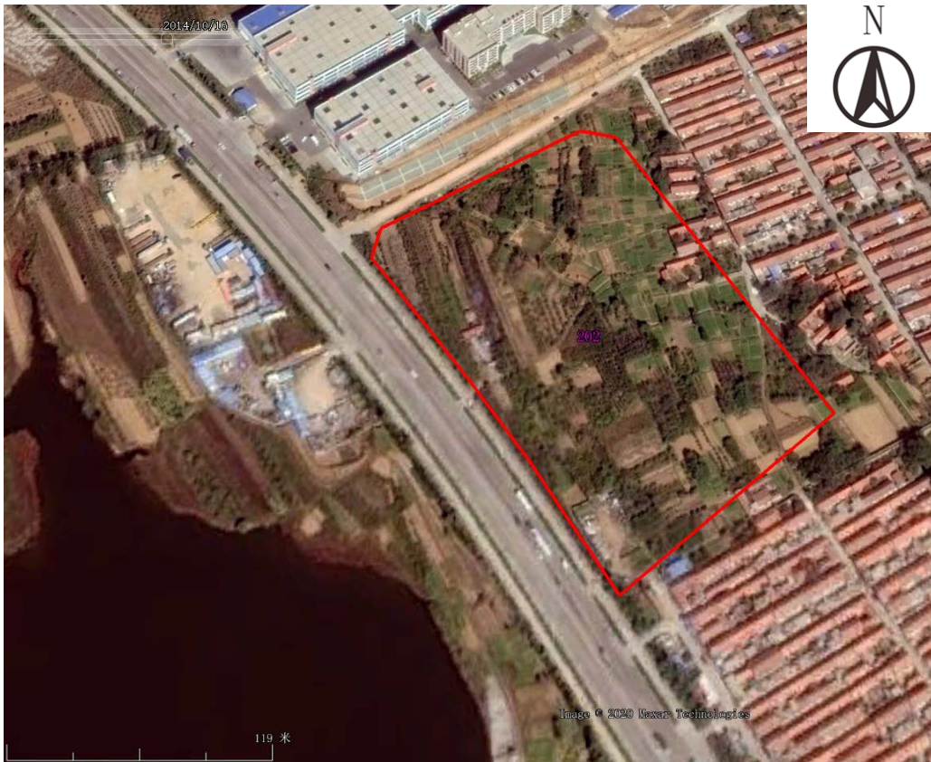
图 3-10 地块及周边历史遥感影像图（2014 年 10 月）