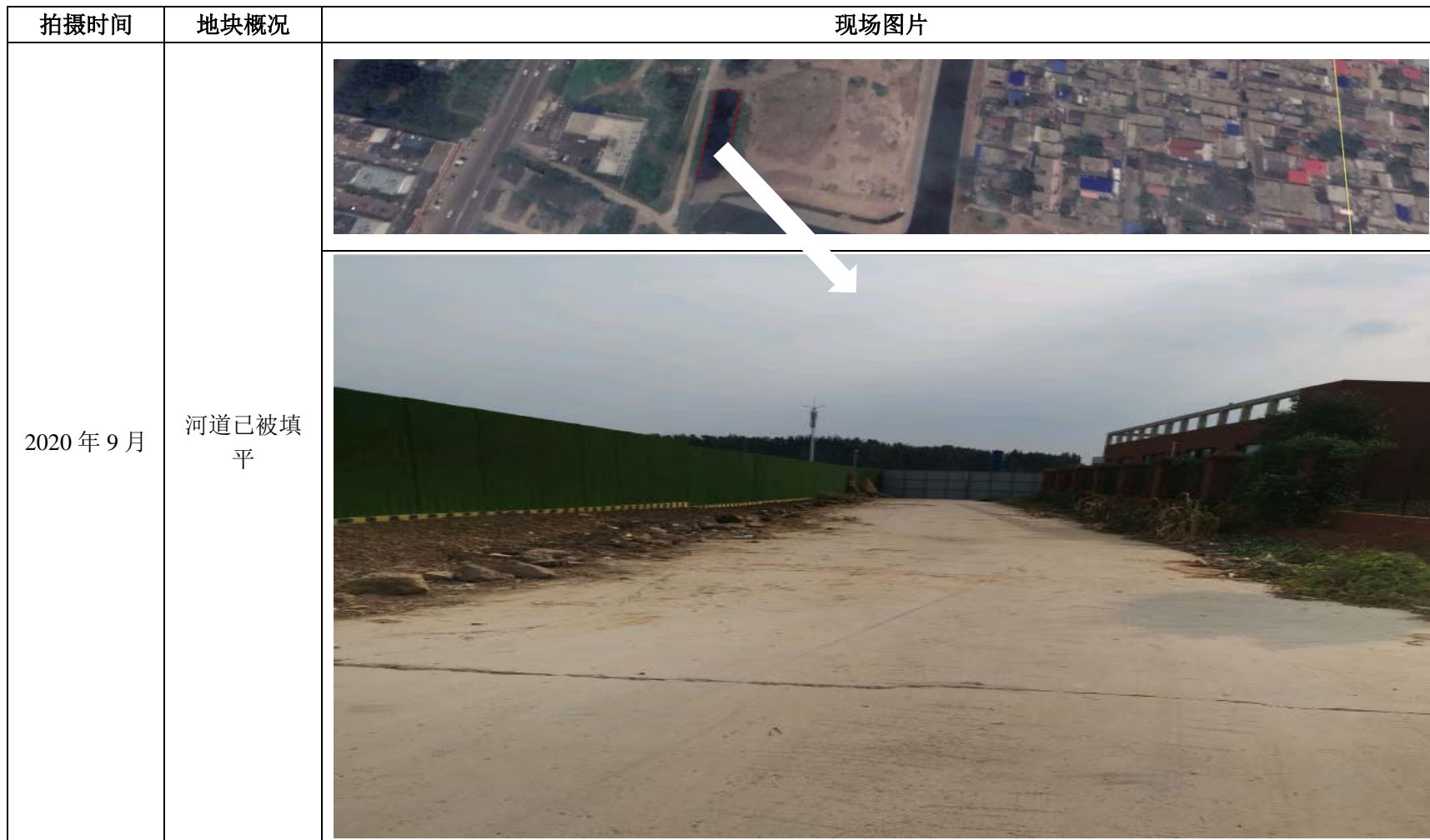
图 3-4 本次调查地块历史变迁影像图