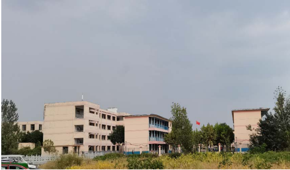
枣庄市薛城区北临城小学