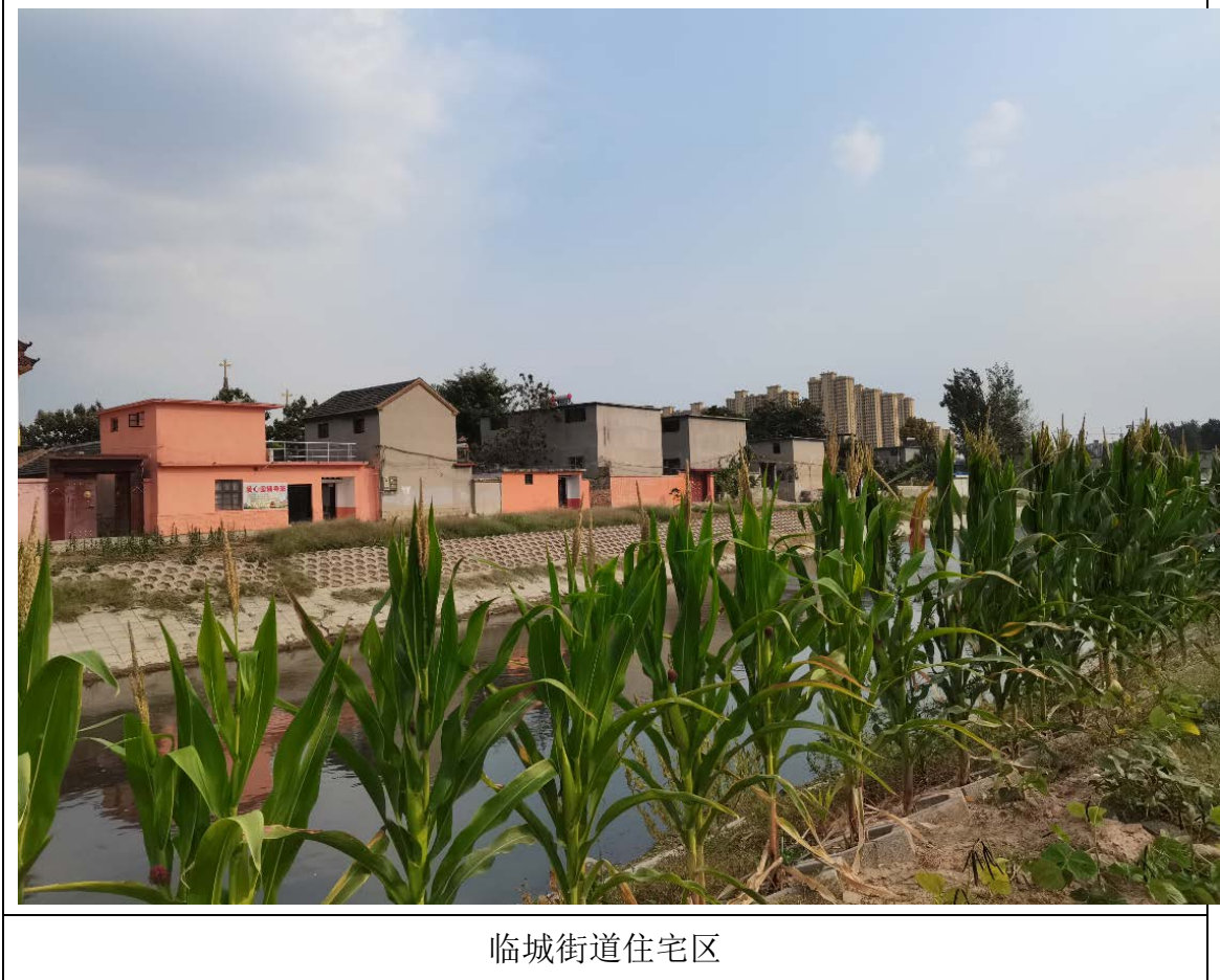
图 3-3 项目周边环境保护目标