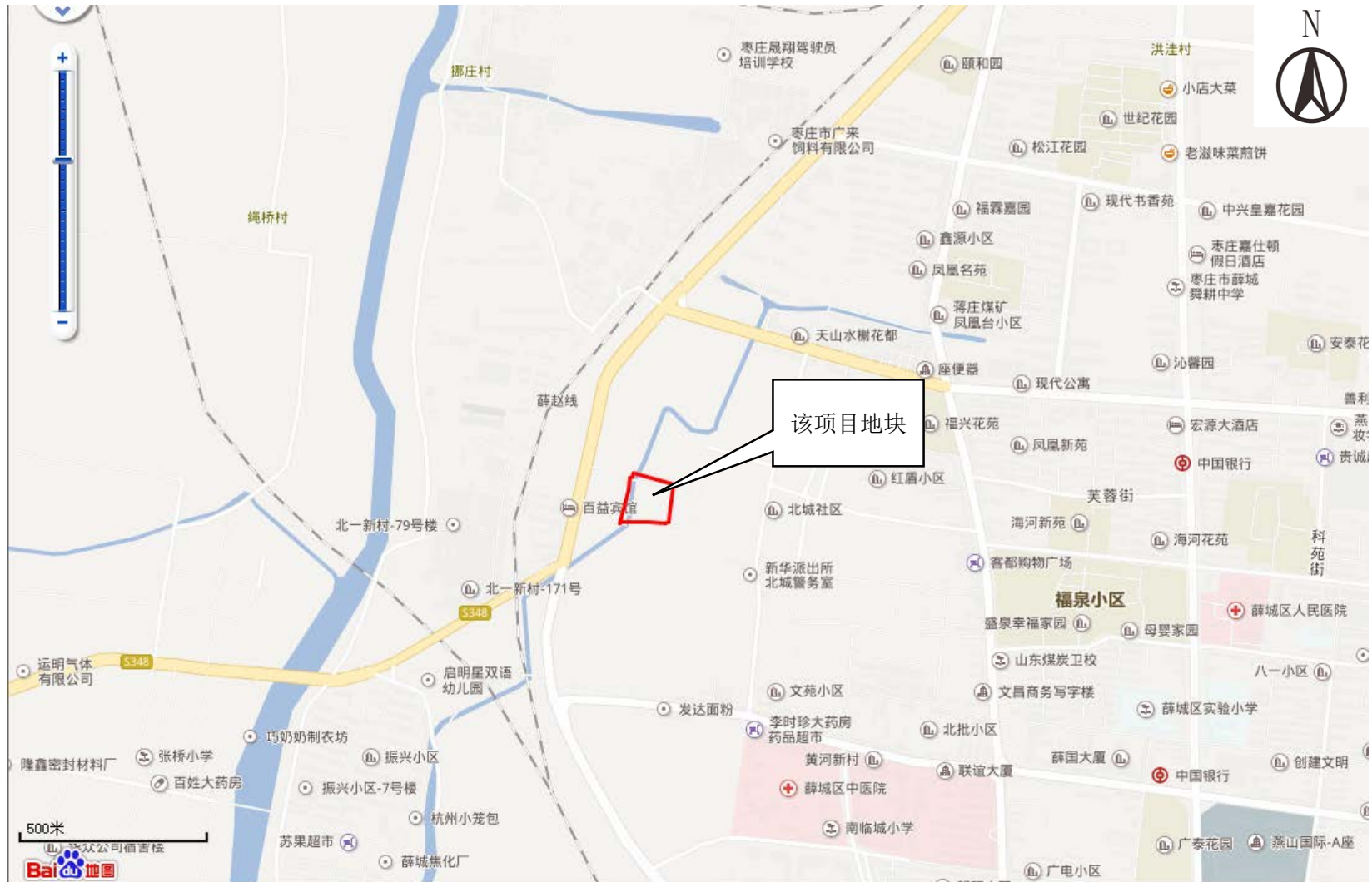
图 3-1 项目地理位置图