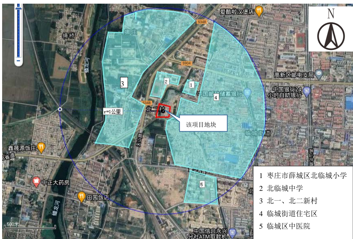
图 3-2 项目周边环境敏感目标图