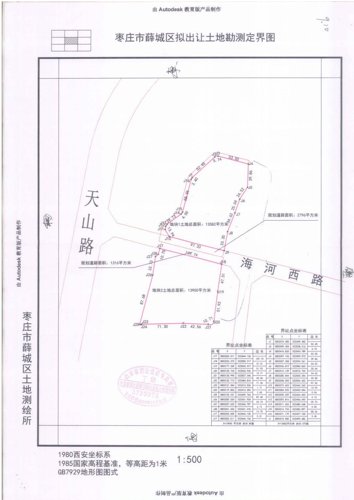
图 2-1 地块四至范围图