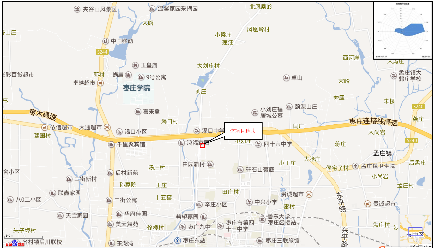
图 3.1-1 项目地理位置图